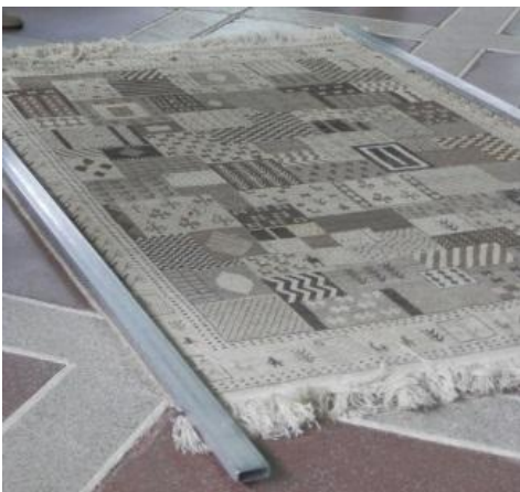
縁の直線出し (縦方向・カッターかがる)